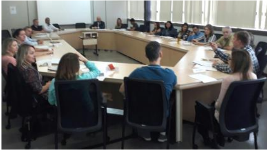
Reunião COMAD_ Conselho Munic. Drogas