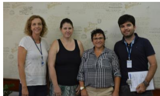
C. E. Santos Dumont & FUNDEPAR