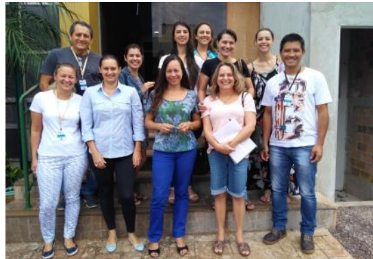
Brasmadeira / Aceleração