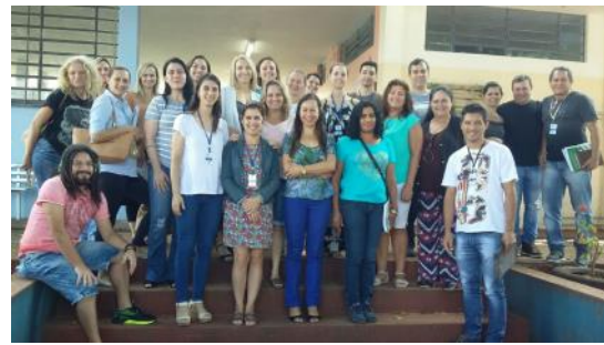
Aceleração / Brasmadeira e Interlagos