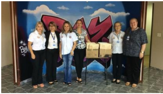
Reunião Diretores e Documentadores Escolares