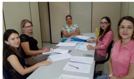
03 03 Assessoramento CRAPE Santa Lúcia