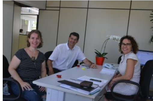
Parceria NRE & Prefeitura Cascavel