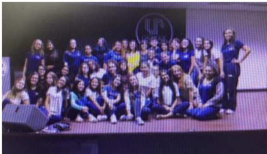
26 03 Formação Docente – C. E. Wilson Joffre