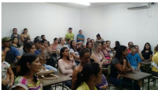
06 03 Reunião EJA abertura APED C. E. Lindoeste