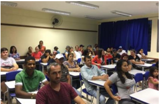
Ação Pedagógica Descentralizada - APED Catanduvas