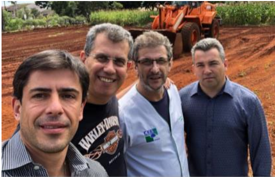
Verificação de obras CEEP Cascavel