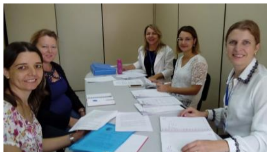
Assessoramento Crape - Professora e Pedagoga do Colégio Alto Alegre do Iguaçú, em Capitão Leônidas Marques