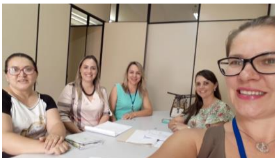
09 03 CRAPE Assessoramento Educação Especial de Boa Vista da Aparecida