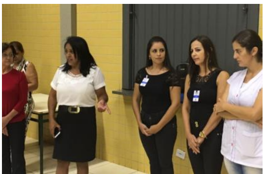
Ação Pedagógica Descentralizada - APED Catanduvas