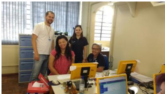
03 03 Cursos Técnicos C. E. Francisco Lima