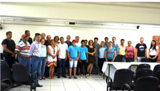
Programa Escola1000_NRE Cascavel