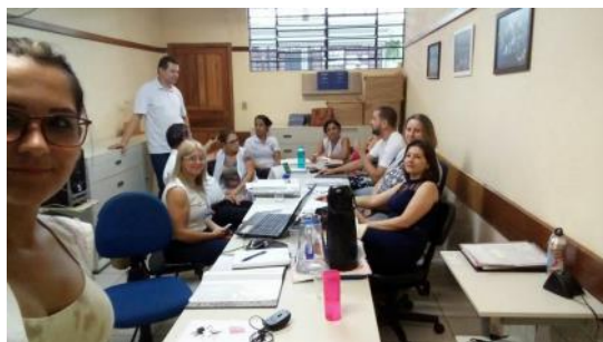
Reunião Educação Profissional C. E. Padre Carmelo Perrone