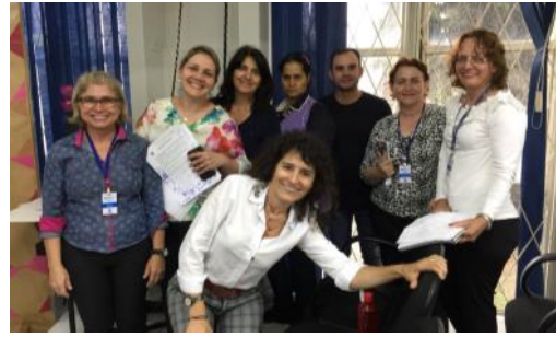
Trabalho em Equipe - Formação Pedagógica NRE