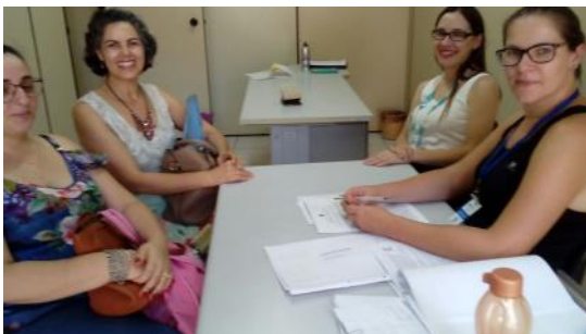
14 03 Assessoramento CRAPE C. E. Cataratas