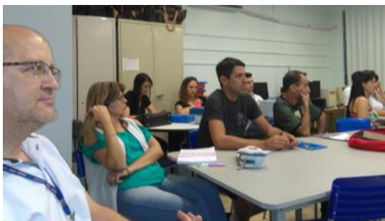
01 03 Equipe NRE em Cafelândia