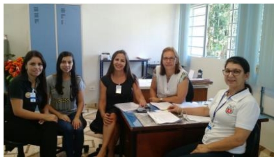
07 03 Assessoramento no C. E. Vital Brasil EJA , Paraná Alfabetizado e Doc. Escolar