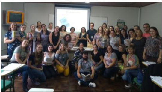
07 03 Formação Língua Portuguesa Técnicos NREs e SEED, em Curitiba