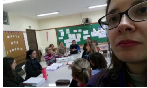
22 05 Reunião e visita domiciliar - Três Barras SAREH