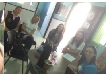
10_05 APAE de Boa Vista da Aparecida Comissão de Monitoramento