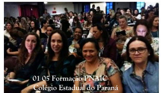
01_05 Formação PNAIC Colégio Estadual do Paraná