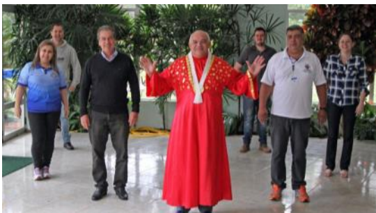
25 05 Momento de descontração / Jogos Escolares