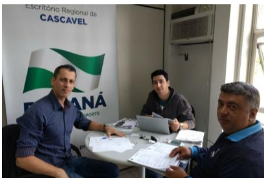
30 05 Seleção Bolsistas Programa TOP Formador