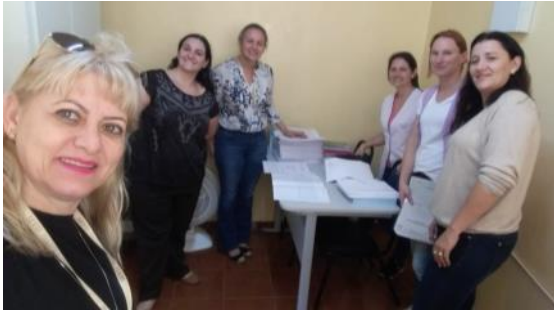
15 05 Verificação APAE de Guaraniáçu