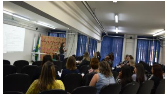
16 05 Formação Plano Municipal de Educação NRE