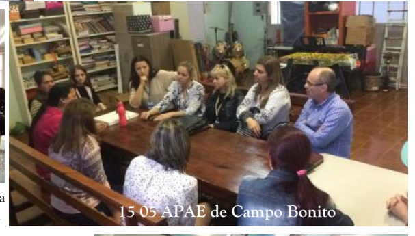
15_05 APAE de Campo Bonito