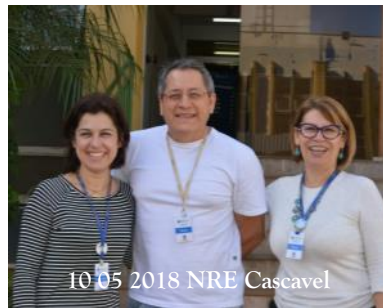
10_05 2018 NRE Cascavel