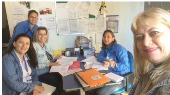
17 05 APAE de Lindoeste – Comissão de Monitoramento