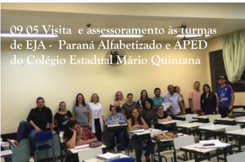
09_05 Visita e assessoramento às turmas de EJA - Paraná Alfabetizado e APED do Colégio Estadual Mário Quintana