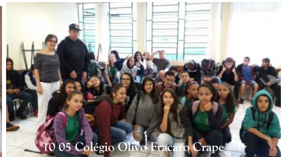
10_05 Colégio Olivo Fracaro Crape