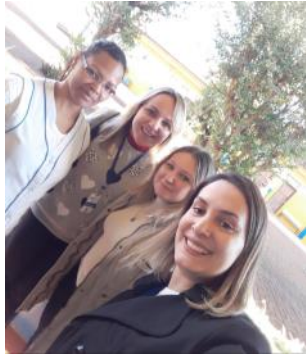
23 05 Colégio Estadual do Campo São João Escuta psicológica emergencial - Crape