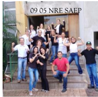
09_05 NRE SAEP