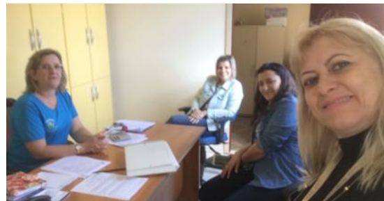
17 05 APAE de Santa Tereza do Oeste