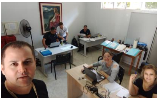
05 CCO dos Jogos Escolares – Cafelândia