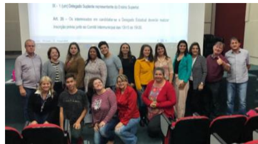
29 05 CONAE Estadual