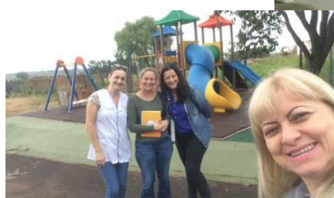
11_05 APAE de Cafelândia Comissão de Monitoramento