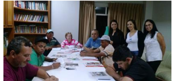
09_05 EJA Paraná Alfabetizado e APED do Colégio Estadual Mário Quintana