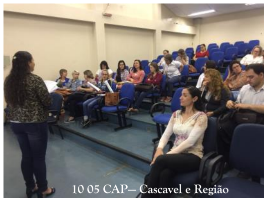
10_05 CAP— Cascavel e Região