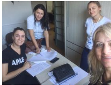
10_05 APAE de Três Barras Paraná Comissão de Monitoramento