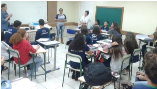
16 05 Educação Empreendedora CEEP