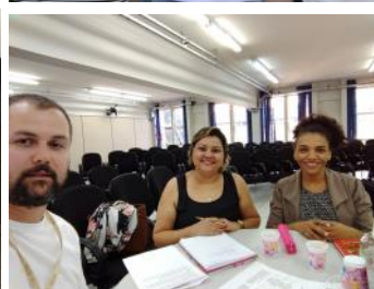
10_05 Reunião com Chefe da Divisão da Reabilitação e a Terapeuta Ocupacional da Penitenciária Federal de Catanduvas