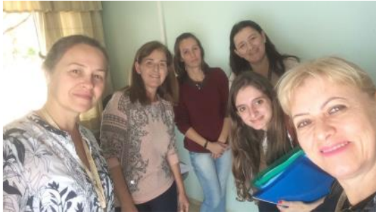
15 05 APAE Guaraniáçu, Ibema, Campo Bonito