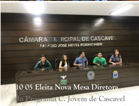
10_05 Eleita Nova Mesa Diretora do Programa C. Jovem de Cascavel