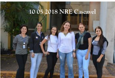
10_05 2018 NRE Cascavel