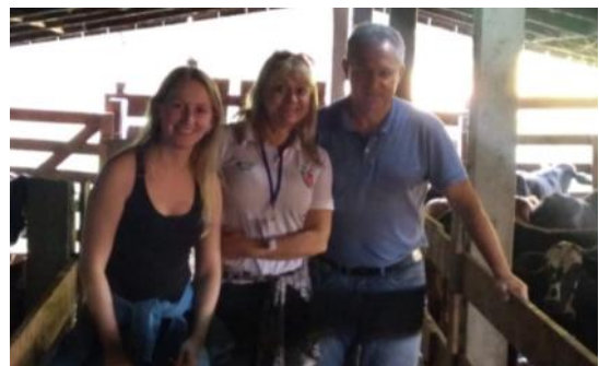
30 05 Verificação curso de Zootecnia CENAP