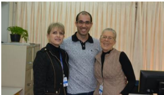
16 05 Protocolo NRE Cascavel