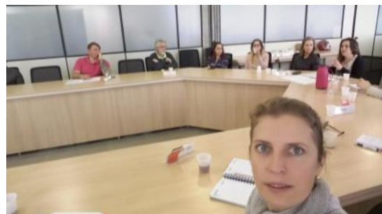
30 05 Reunião Comad_ Conselho Municipal de Políticas Públicas sobre Drogas_ Andrise_ Crape