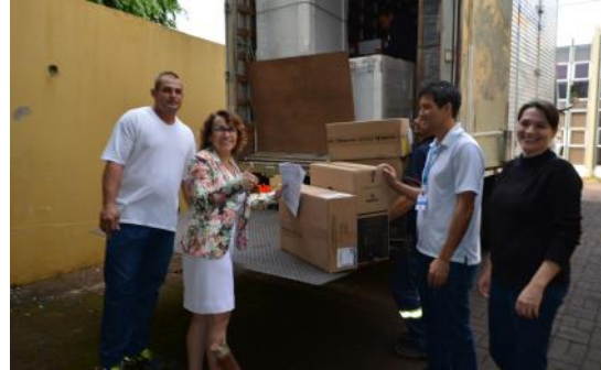
16 05 Computadores ao NRE Cascavel