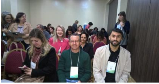
22 05 Evento do Censo Escolar 2018 em Foz do Iguaçu