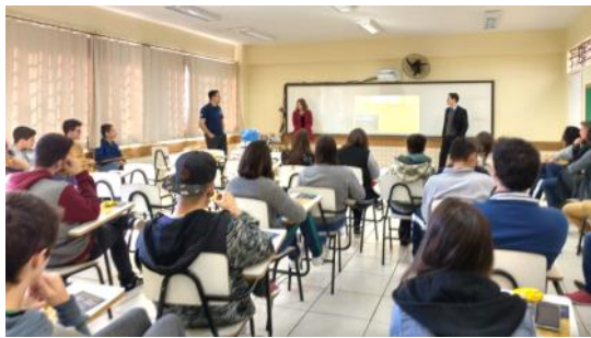
29 05 CEEP Palestra ACIC