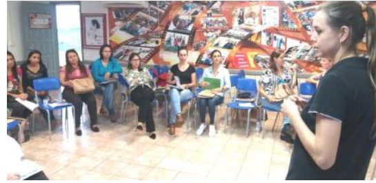
15 05 Caminhos Pedagógicos em Foco