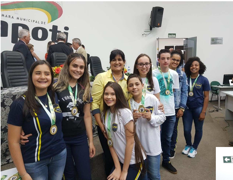
C.E Rui Barbosa