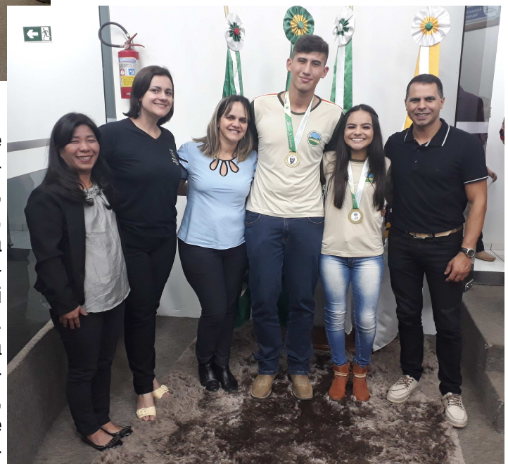
Centro Estadual de Educação Profissional—CEEP

No dia 12 de abril a Câmara Municipal de Arapoti realizou a Premiação da 2ª edição da Medalha Rui Barbosa. A cerimônia realizada no Plenário da Câmara premiou 130 alunos de 20 instituições de Ensino Público e Privado, entre escolas, colégios, centros de educação profissional e de ensino superior. A medalha foi entregue aos alunos que se destacaram em 2018, levando em consideração notas, disciplina e frequência escolar, conforme o Decreto 231/17. A cerimônia aconteceu em três horários: às 14 horas, momento em que foram homenageados os