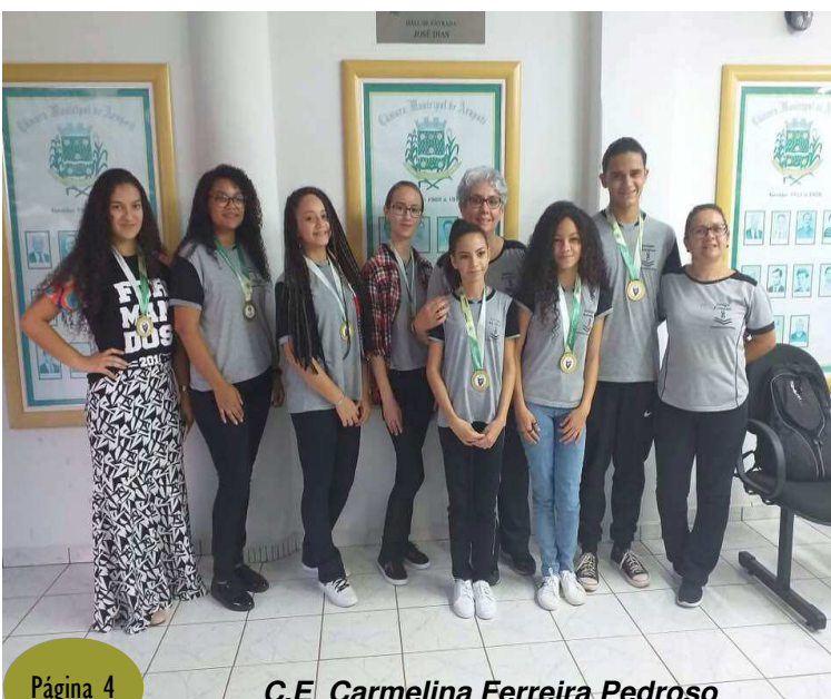
C.E. Carmelina Ferreira Pedroso