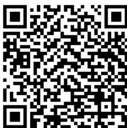
Planilha de Vagas

Segundo a Resolução n.º 1.258/2020 – GS/SEED, de 28 de abril de 2020, que altera os dispositivos da Resolução n.º 4.639/2019 – GS/SEED, de 6 de dezembro de 2019, a distribuição de aulas continuará ocorrendo às terças e quintas-feiras de forma ON-LINE, para os municípios de Maringá, Paçandu e Sarandi . As vagas existentes serão divulgadas nas mesmas planilhas já utilizadas , e que podem ser acessadas pelo endereço eletrônico abre.ai/nremaringadistribuicao ou pelo QR Code abaixo: