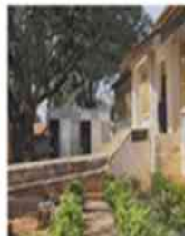
Banheiro fora do prédio