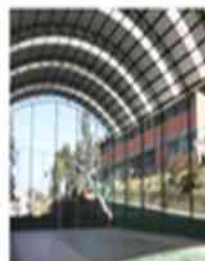
Quadro de esporte coberto