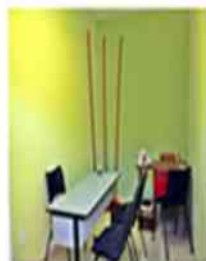
Sala de diretoria