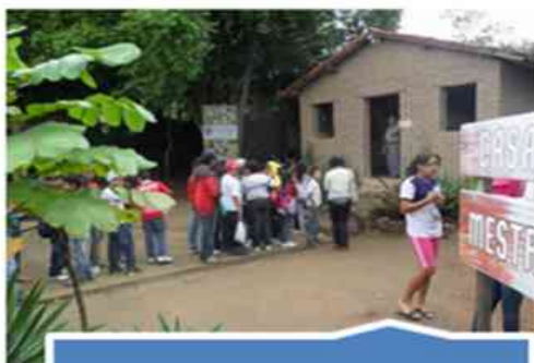
Casa do professor