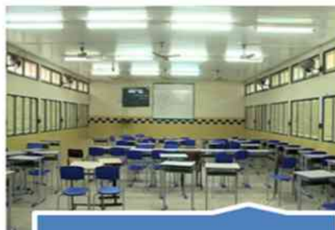
Salas em outra escola