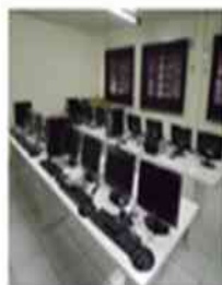
Laboratório de informática