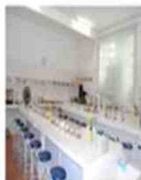
Laboratório de ciências