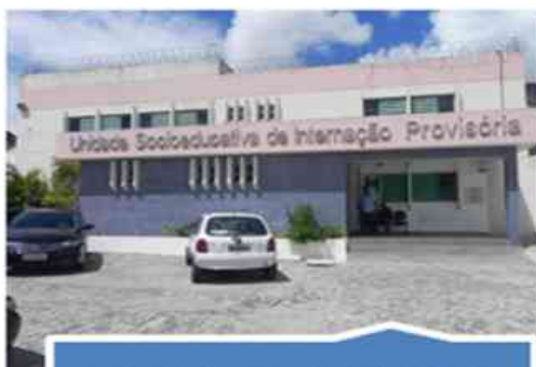
Unidade de atendimento socioeducativo