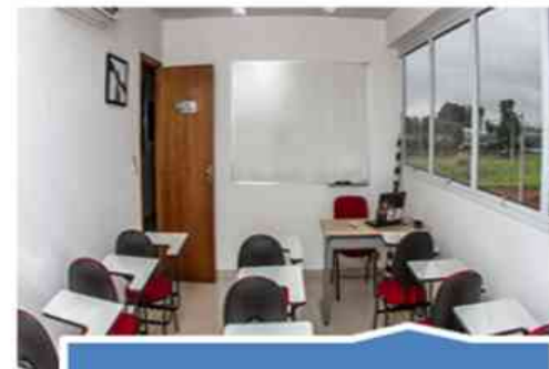
Sala de empresa