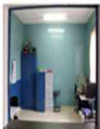
Sala de secretaria