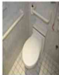
Banheiro adequado a alunos com deficiência