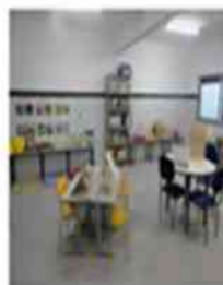
Sala de recursos multifuncionais