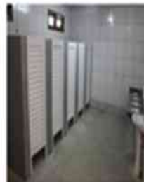
Banheiro dentro do prédio