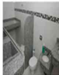
Banheiro adequado à educação infantil