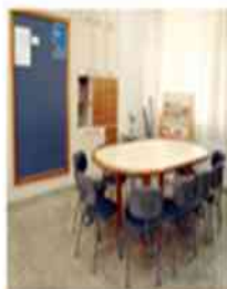
Sala de professores